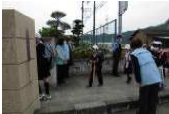
(5/12 民生委員さんによるあいさつ運動)

昨年の今頃は、臨時休校（4月末～5月末）でした。今年は、子どもたちの顔を見ることが出来ます。声を聞くことが出来ます。話をする事が出来ます。本当に嬉しいことです。これからも、この佐伯小学校で多くの人と関わりながら時間を過ごすことで、多くのことを学び、成長して行って欲しいと心から願っています。