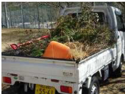
【45Lごみ袋約10袋・トラック約10杯分集まりました！】

私たちの目的のためにわざわざ動いて下さった地域の方々、区長さん、保護者の方々、テレビ局の方々などたくさん足を運んでくださりありがとうございました。